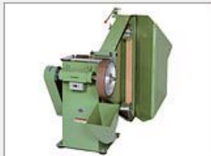
ベルトグラインダー

各種研磨材製品の性能をフルに発揮する為に、優れた機械装置をお選びいただけます。 性能、設置場所等にあわせオーダーも可能です。