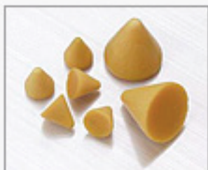
プラスチックメディア