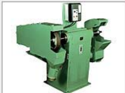
羽布レース（グラインダー付）